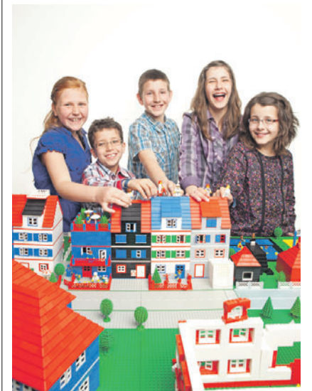
Geplant ist eine zehn Meter lange Stadt aus LEGO-Bausteinen.

SCHAAN Die Ländle-Jungschisch, Jungschar der Freien Evangelischen Gemeinde Schaan, sucht fleissige LEGO-Baumeister. Vom 11. bis 14. Oktober haben Kinder der 1. bis zur 7. Klasse die einmalige Gelegenheit, aus Tausenden von LEGO-Bausteinen eine über zehn Meter lange LEGO-Stadt zu konstruieren. Gebaut werden viele Traumhäuser, ein Fussballstadion, ein Flughafen, eine Poli-