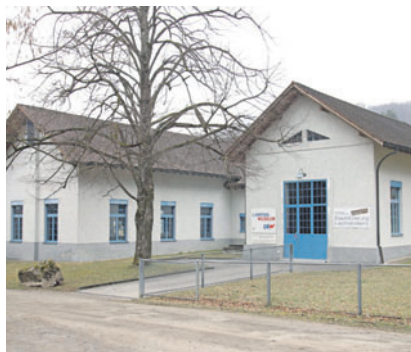
Das Lawena Museum.

TRIESEN Verbinden Sie den Sonntags-Spaziergang mit ihrer Familie und Freunden mit einem Besuch im Lawena Museum. Es hat am kommenden Sonntag, den 30. September, von 13 bis 17 Uhr geöffnet. Der Verein pro-